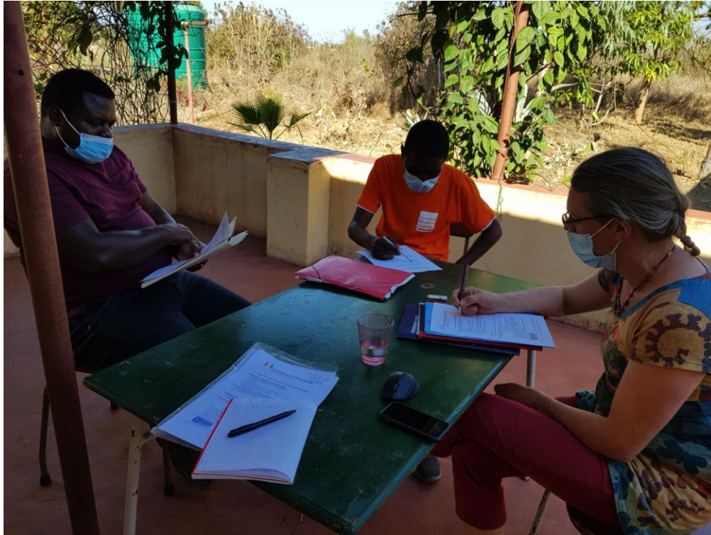
Samen evalueren en plannen bespreken

Samen bespreken we de ideeën en plannen, luisteren naar elkaar en wisselen ervaringen en informatie uit. We scholen ons voortdurend van beide kanten bij.