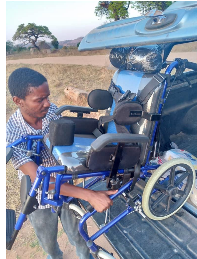
De auto in gebruik voor het transport van hulpmiddelen

met een dergelijke donatie in augustus een (gebruikte) 4x4 auto kopen zodat de huisbezoeken en de steungroepen ook in het regenseizoen, dat nu is begonnen, kan blijven draaien. Als het project wil groeien, moet ook de organisatie groeien om het project te kunnen blijven voortzetten. Daarom is het voor ons belangrijk dat de lokale Trust versterkt wordt zodat ze het project zelf kunnen blijven runnen. Dit is ook ons gezamenlijke doel in 2023.