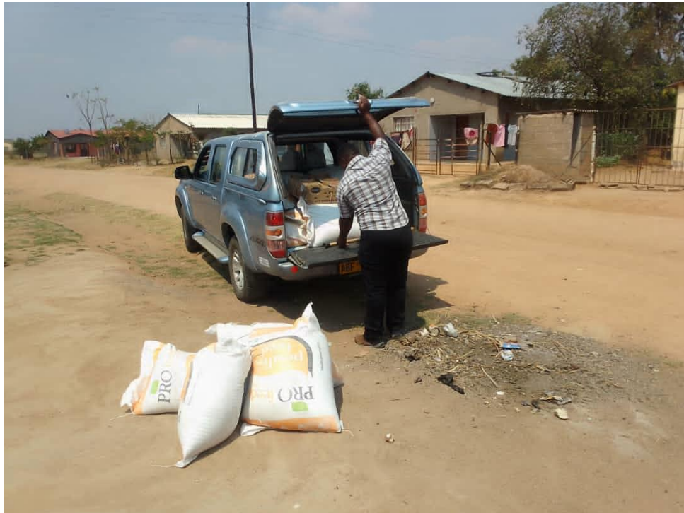
De nieuwe auto: hier bij transport van middelen voor onze income generating projecten

Grote sponsors bepalen vaak zelf waar ze hun geld voor willen gebruiken, waardoor het recht op persoonlijke ontwikkeling wordt genegeerd. We gaan daarom bewust op zoek naar donateurs die ons en de Trust vertrouwen en willen investeren in de behoeften van lokale