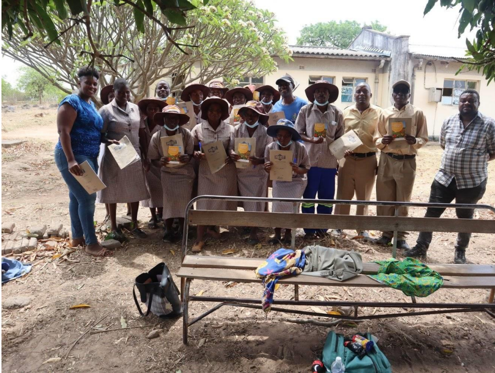
Uitreiking certificaten na de VHW training